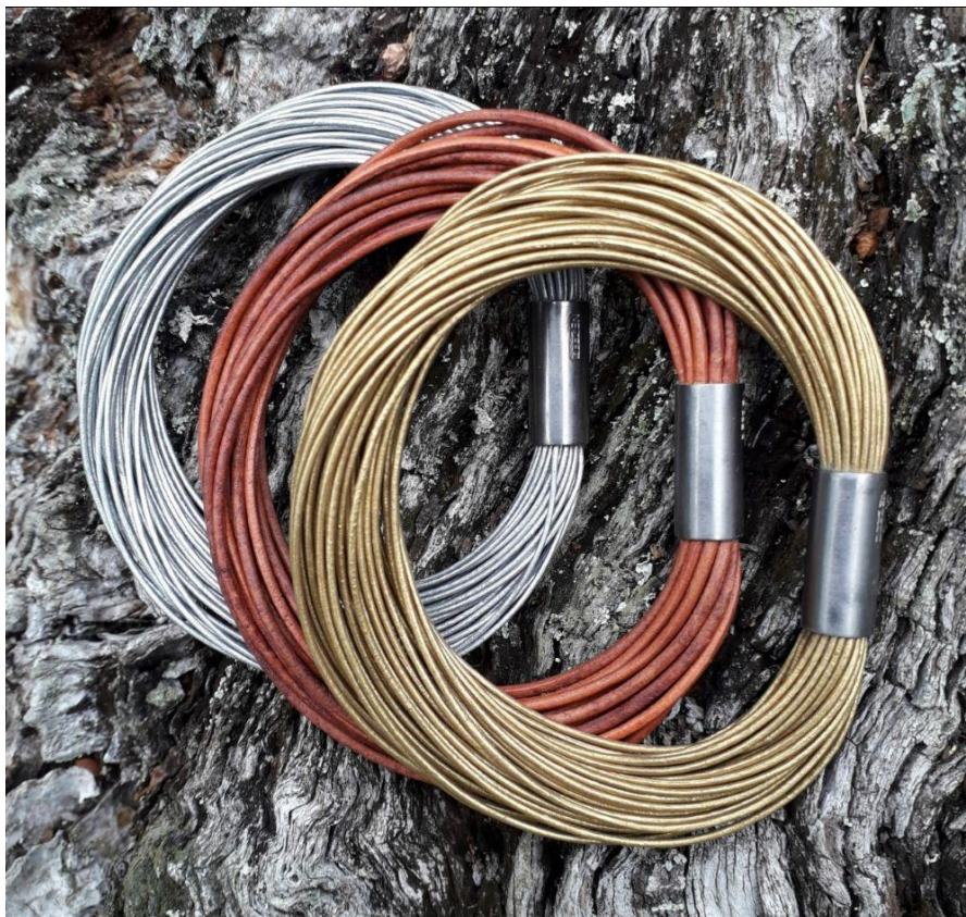
Mine signaturarmbånd med magnetlås i titanium, i matchende farver til kæden.