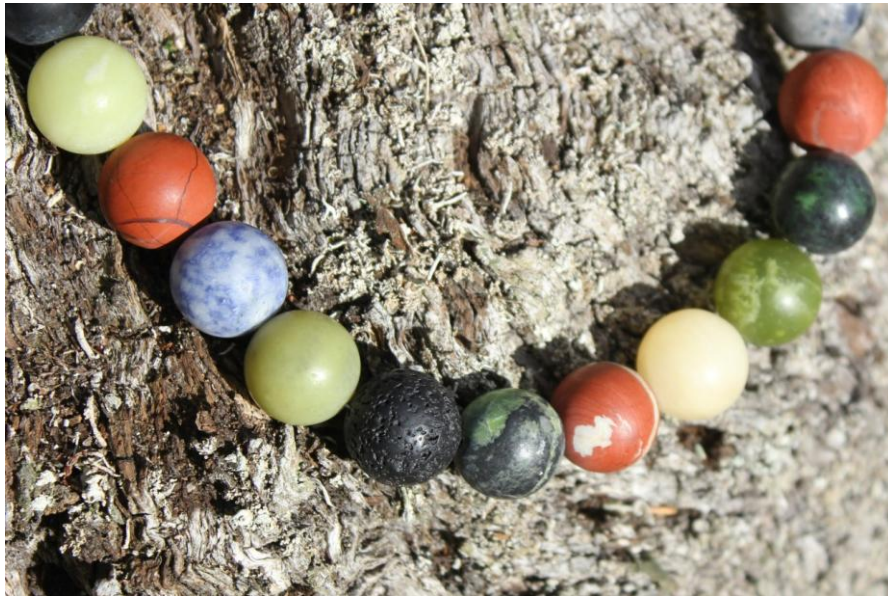
Store flotte stenperler i sensommerfarver, særpris: 795,- fås i 2 variationer med forskellige låse.